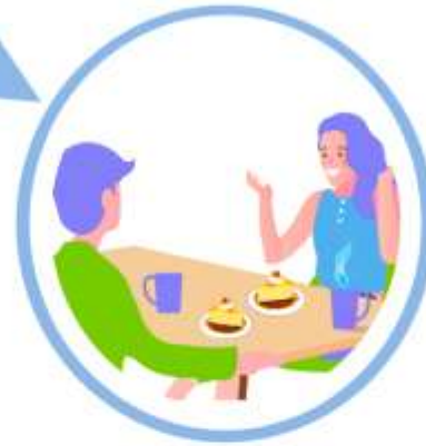
ПОСЕЩЕНИЕ COVID-FREE МЕСТ