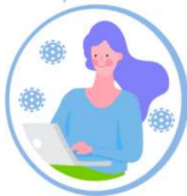
ЛЕГКОЕ ТЕЧЕНИЕ COVID-19 В СЛУЧАЕ ЗАРАЖЕНИЯ